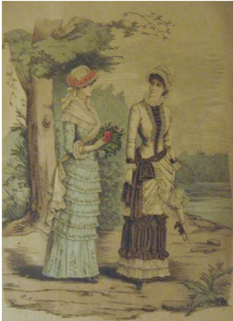
Figura IV – Gravuras de mulheres publicada no Jornal A Estação em 1881

Deste modo, juntamente com a ampliação do campo de atuação dos jornais que passou da esfera das notícias e da política para a cultural e da literatura, divulgando cada vez mais idéias que se queria difundir na sociedade, formava-se a opinião pública e difundiam-se crenças, tanto no espaço público quanto privado. O alcance dos jornais no espaço privado demandava a criação de periódicos destinados ao público da casa, as mulheres. Assim, diversos periódicos foram criados a fim de atender à demanda deste grupo específico, baseando suas publicações no que se supunha ser de seu interesse e de acordo com a representação que delas se tinha. Neste período foram fundados diversos jornais e revistas destinadas ao sexo feminino, sendo alguns escritos por homens e outros, já na segunda metade deste século, escrito pelas próprias mulheres.