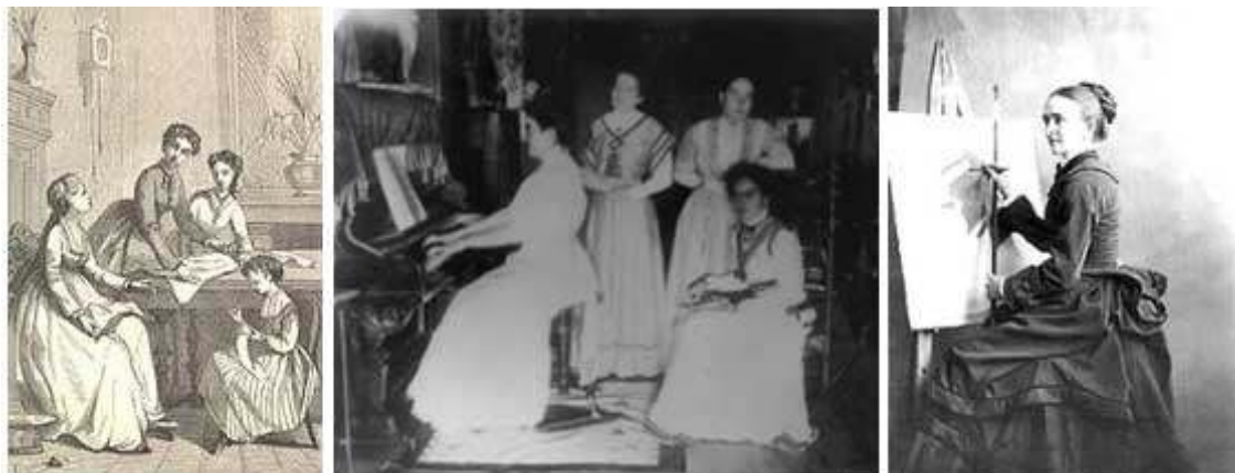
Figura III – Mulheres do século XIX

As representações do feminino podem ser corroboradas por um depoimento de Teresa Billington (1884), reproduzido no artigo de Machado (2006), no qual afirma que as meninas eram